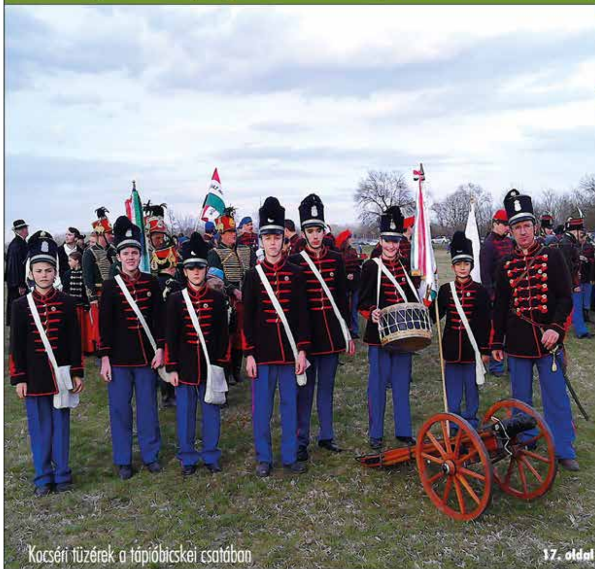
Kocséri tüzérek a tápióbicskei csatában

Nagykőrös - Abony - Cegléd - Csemő - Jászkarajenő - Kocsér - Körösetetlen - Nyársapát - Törtel