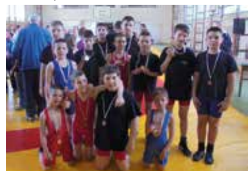
Nagykőrösi Birkózó Szakosztály ifjai a következő

A Ceglédi Nagycentrum verseny idején is Nyársapáton került megrendezésre, ahol a diák korcsoportok kötött, míg a gyermek korcsoportok szabadfogásban mérték össze az erejüket.