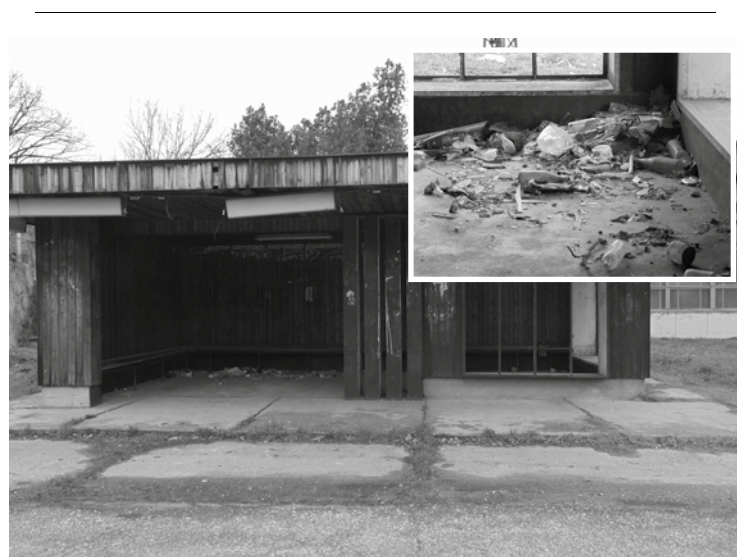
József Attila utca, konzervgyári buszmegálló - VOLT!