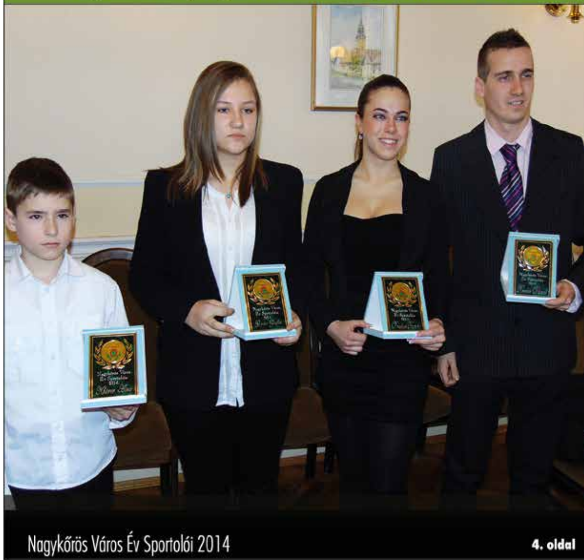
Nagykőrös Város Év Sportolói 2014

Nagykőrös - Abony - Cegléd - Csemő - Jászkarajenő - Kocsér - Körösetetlen - Nyársapát - Törtel