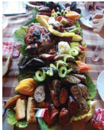
Különdíjak A legjobb fehér hurka: Jász-