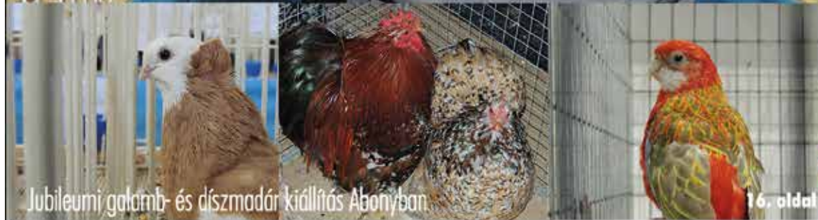
Jubileumi galamb- és díszmadár kiállítás Abonyban