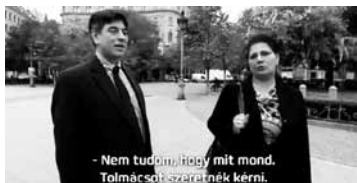
- Nem tudom, hogy mit mond. Talmácsok szára nekik kéri.