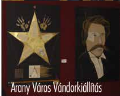
Arany Város Vándorkiállítás