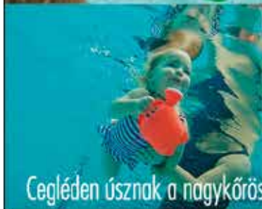
Cegléden úsznak a nagykőrösi babák