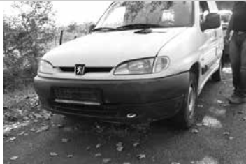
Személyi sérülés nem történt.

2014. szeptember 28-án 12 óra 10 perckor anyagi káros baleset történt. A 47 éves ceglédi férfi a 441 számú főúton Cegléd irányába közeledve nem az út minőségének megfelelően választotta meg furgonjának sebességét, mely megcsúszott és menetirány szerinti bal oldali árokban állt meg.