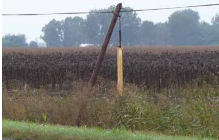
Kettőtört oszlop - melynek várja sorsát a 441. sz. főúton feltehetőleg egy mezőgazdasági gép az okozója - napok óta között.