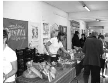
A délelőtt folyamán termék-bemutatók és kóstolók tették