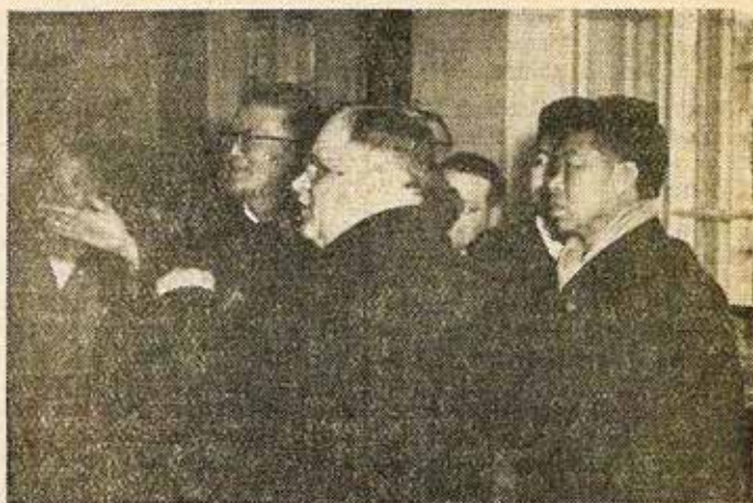
A vendégek az Arany János irodalmi múzeumban

ség első titkára, annak felesége — Fong Huéj-pin — és Cseen Kan egyetemi hallgató társaságában, baráti látogatásra érkeztek hozzánk.