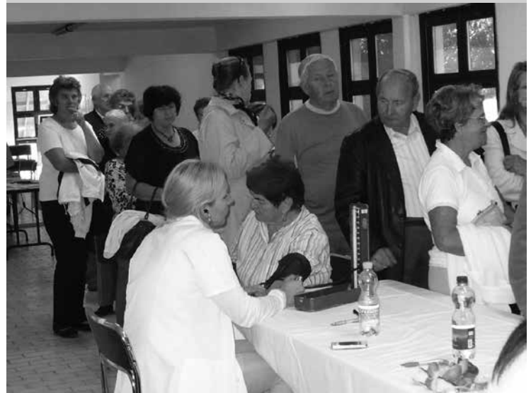
A Magyar Kardiológusok Társasága és a Magyar Nemzet Szív-