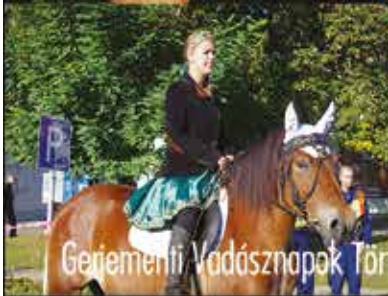
Genyementi Vadásznapi Törtelen