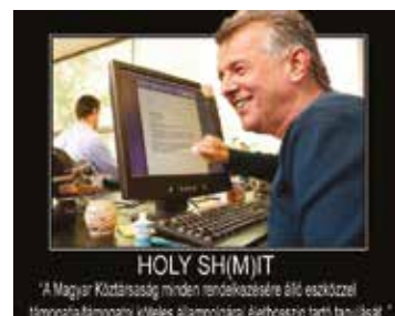
HOLY SHIMJIT "A Magyar Köztársaság minden rendelkezésére álló eszközzel támogatja a Magyar Köztársaságban élő állampolgárok életkörülményeinek javítását"

köztestársasági elnök legyen – de már köztestársaság nélkül!