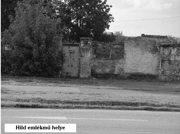
Hild emlékmű helye

Meg kell állapítsuk, Nagykőrös „megyei jogú„ város vezetéséhez nincs szükség képviselői közreműködésre! Elég, ha az aprómunkától mentesítve képviselőinket, minden döntés részletének ódiáját, városvetőnk – úgyis, mint volt „maszopos” párttag – magára