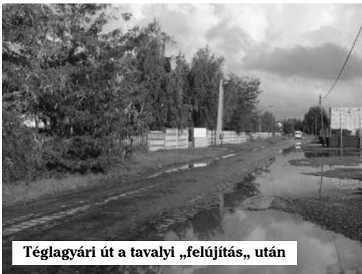
Téglagyári út a tavalyi „felújítás„ után

De meggondolandó a műalkotás kisebb változatának elhelyezése, a most javasolt helyszín közelében, a Téglagyári-út mentén, amit már