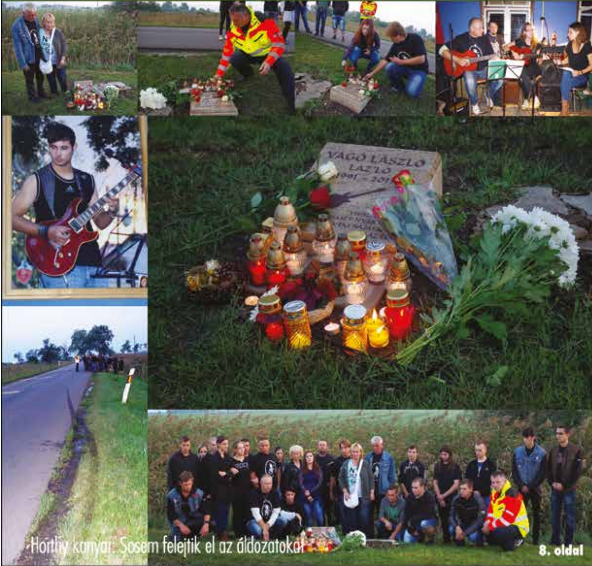
Hortly kanyar: Sosem felejtik el az áldozatokat

Nagykőrös - Abony - Cegléd - Csemő - Jászkarajenő - Kocsér - Körösetetlen - Nyársapát - Törtel