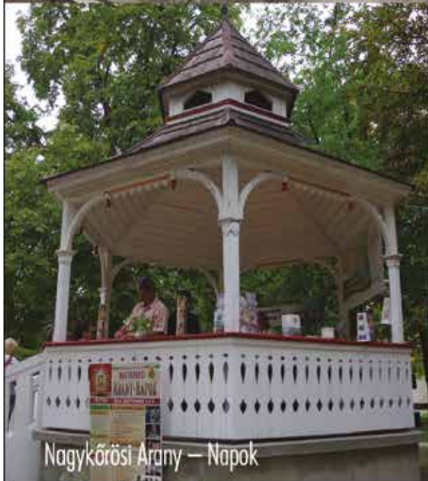
Nagykőrösi Arany – Napok