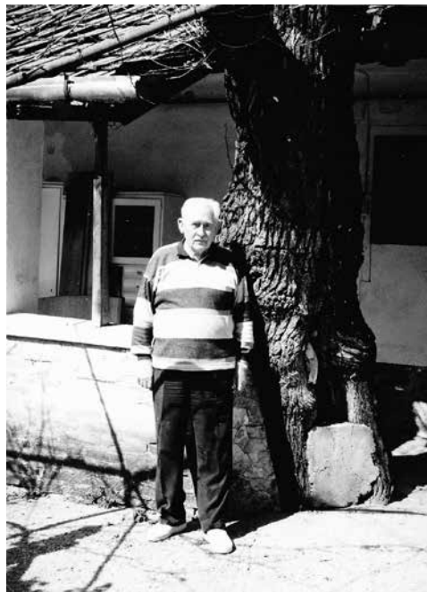
máshol munkát keresni. Miután a „kubikolással” szerzett viszonylagos jólétük veszélybe került.

- Valamikor érintőlegesen azt olvastam, hogy azokban az években befejeződtek a nagy köz-munkaprogramok. Vasútépítések, folyószabályozások. A fölöslegessé vált – mondjuk így – korábbi agrárproletárok, kénytelenek voltak