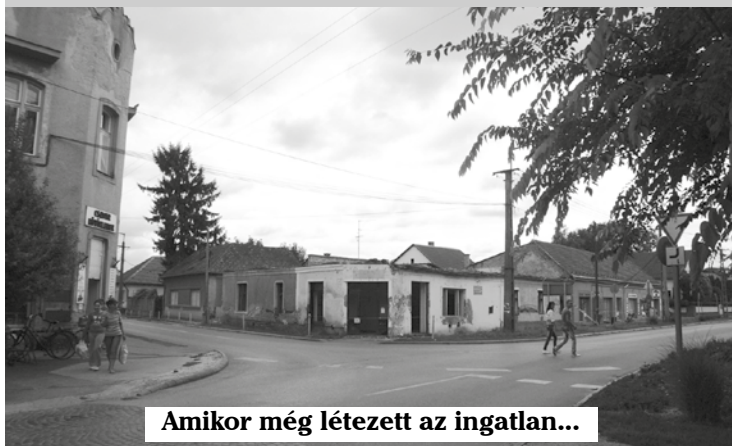
Amikor még létezett az ingatlan...