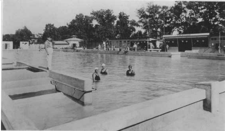
Nagykovácsó „Ártézi” strandfürdőt épített!

Ugorjunk egy nagyot az időben. A XX. század elején majd' minden település létesített egy közfürdőt, hiszen csak a nagyon tehető emberek házában volt fürdőzésre alkalmas helyiség. Tisztálkodni pedig fontos volt. Nagykovácsónak is volt, és a nyolcvanas évek közepéig még működött is a gőzfürdő, melyben egy személyes kádfürdők voltak, valamint egy medence a közös fürdést kedvelőknek. S mint tudjuk, elsőként a térségben, 1932-ben Dezső Kázmér polgármestersége idején,