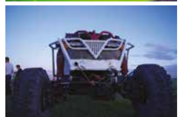
Részletek minderről később.